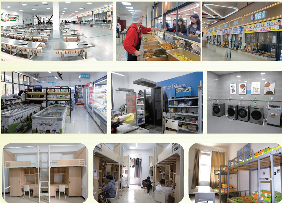
标准 4 人间